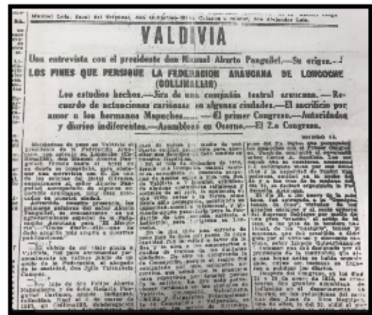
Imagen solo para ver el original.